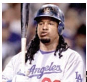
Manny Ramírez ejerció la opción de su contrato.