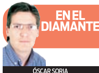
EN EL DIAMANTE ÓSCAR SORIA