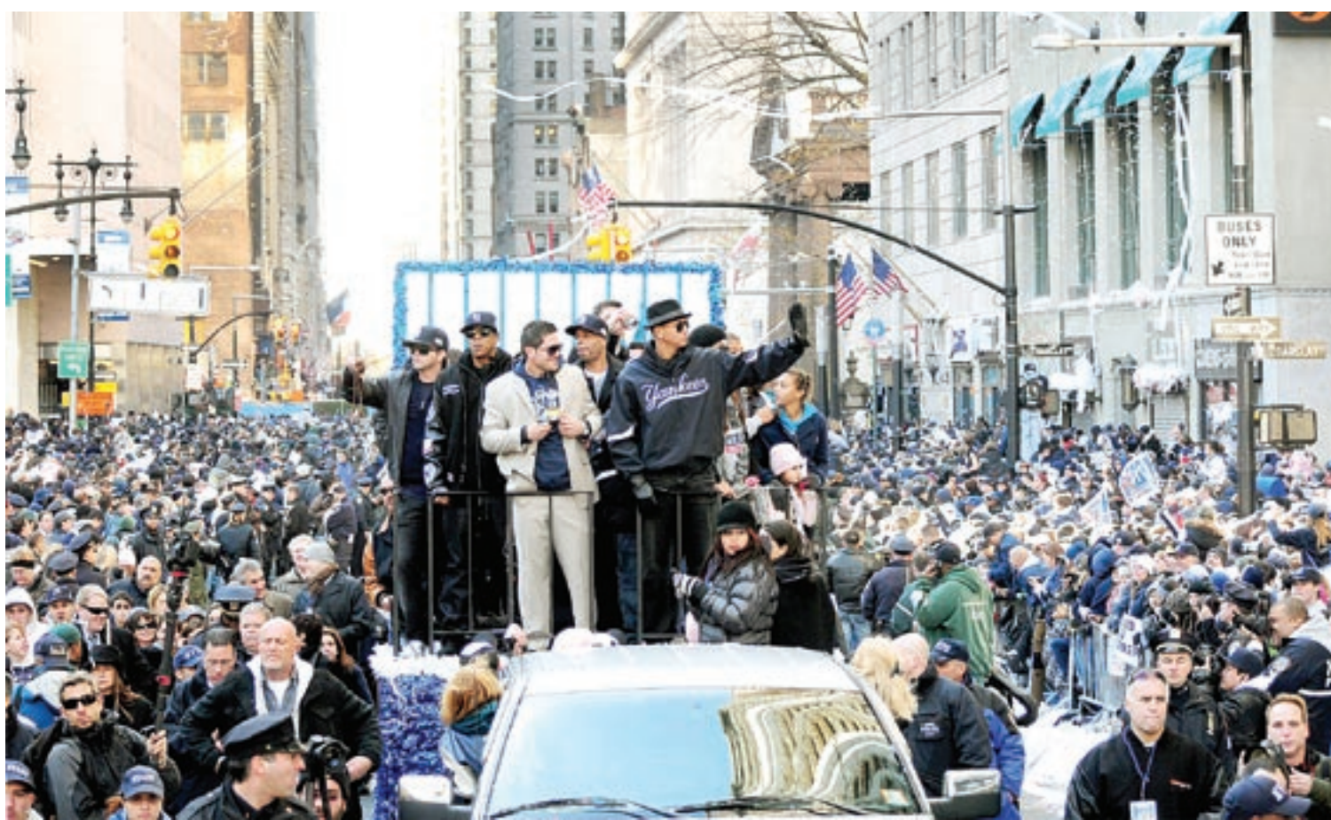
Miles de fanáticos de los Yanquis salieron a las calles de Nueva York a acompañar a los campeones en su desfile.